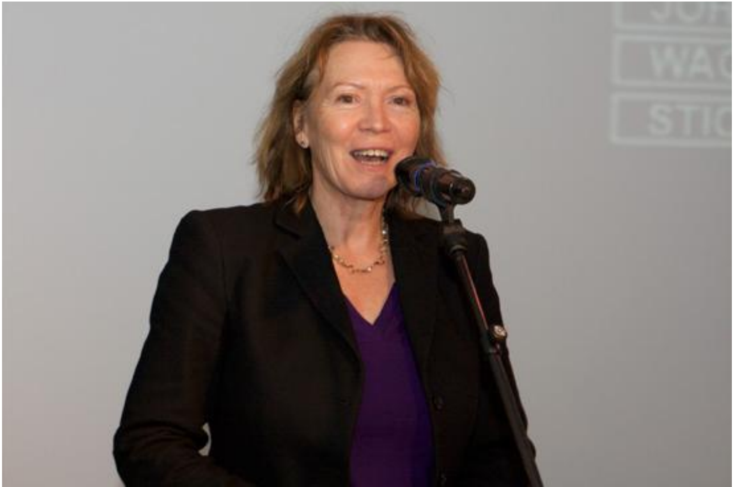
Juryvoorzitter Winnie Zorgdrager