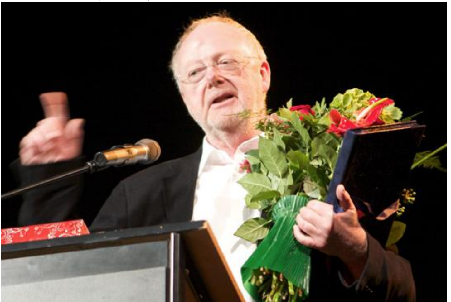
Dankwoord Louis Andriessen