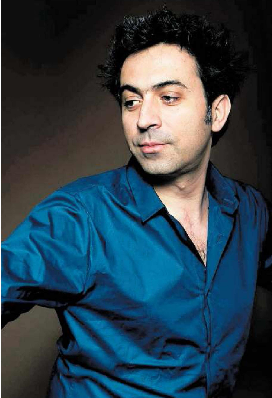
„Het is leuk dat mijn muziek nu veel aandacht krijgt, maar van binnen verandert er niets.”